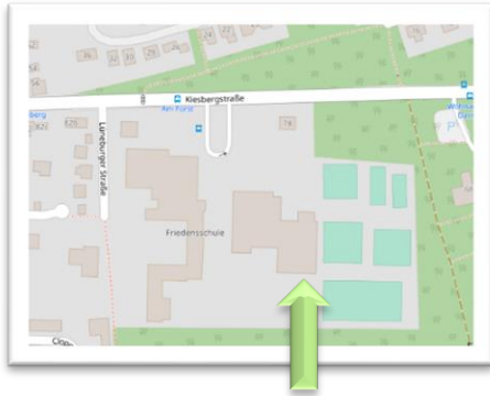
KiTa am Kiesbergwald

Unsere Einrichtung liegt im Stadtgebiet Lingen (Ems), am Rande des Ortsteils Laxten direkt neben der Friedensschule.